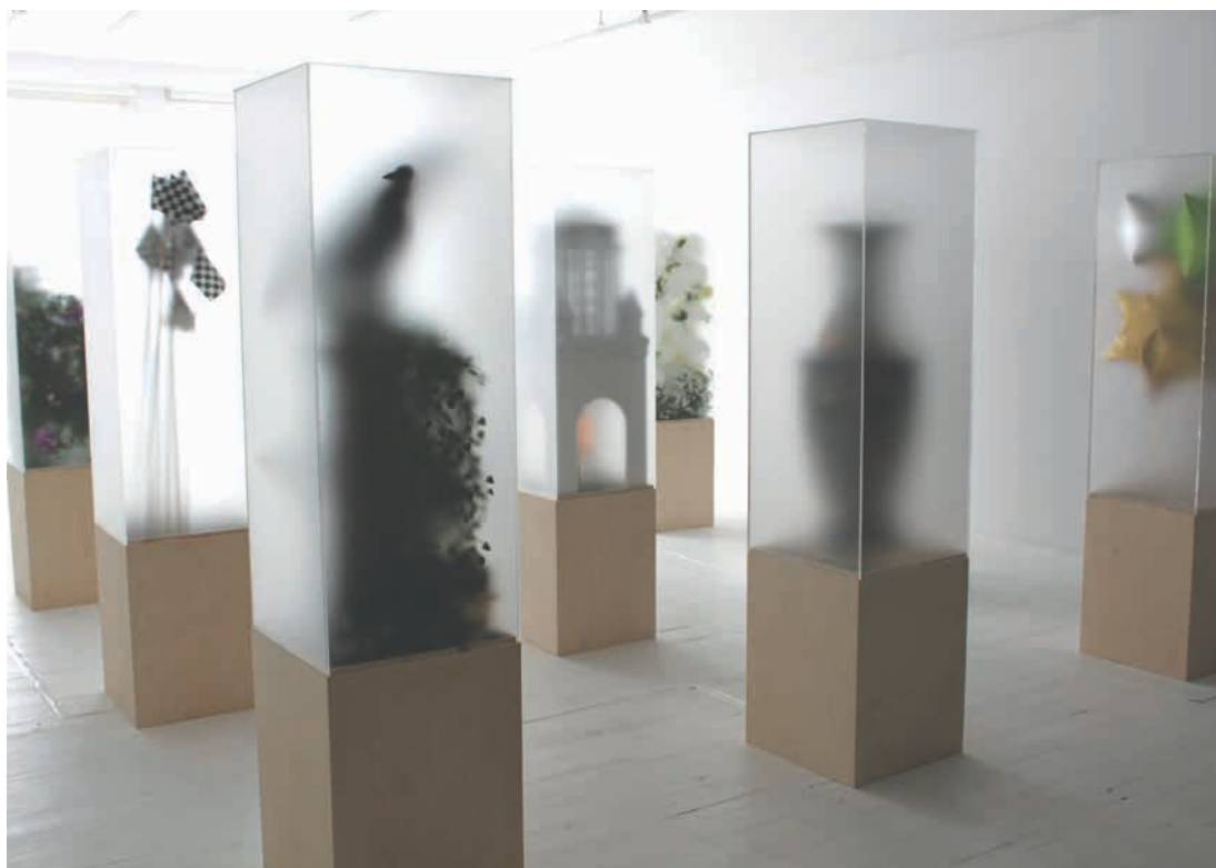
Mathieu Valade