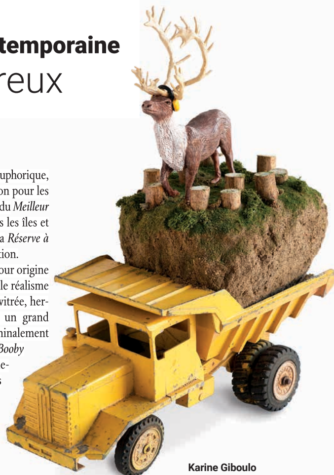
Karine Giboulo Photo : Karine Giboulo

Karine Giboulo, dont l'œuvre a pour origine la contestation sociale, présente, avec le réalisme qui caractérise son travail, une usine vitrée, hermétiquement fermée, dans laquelle un grand nombre de personnes effectuent machinalement la tâche qui leur est assignée. Intitulée Booby Trap , l'installation a été créée spécialement pour la Biennale. Les têtes des travailleurs sont pourvues de casques semblables à ceux que mettent les amateurs de réalité virtuelle. Lorsque les habitants de l'État mondial éprouvent une contrariété,